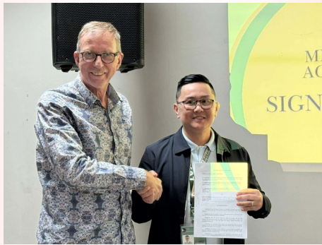
Ondertekening samenwerking met burgemeester van onze stad (120.000 inwoners).