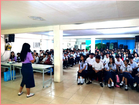
Preventietraining aan High-school voor 120 tieners.